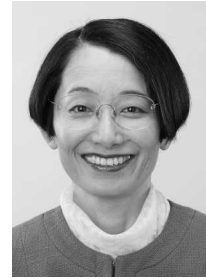
ネットワーク 三芳