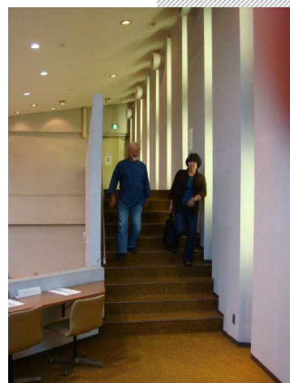
傍聴席への道のり

いくつかの議会傍聴規則を見ただけでもこんなに「へん」がありました 傍聴席がバリアフリーになっていない所も多く、障害者や高齢者の傍聴は難しい状況です。各自治体の議場・委員会など、調べるとまだまだ出てきそうです。 買い物ついでに気楽に議会傍聴（市民の目でチェック）ができるように、へんな規則はなくしたいですね。（大橋）